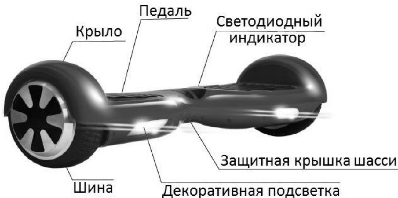
1 - сурет.

Гироскутер динамикалық тұрақтылық қағидаты бойынша жұмыс жасайды, бұл құрылғы жылдамдығы жоғары орталық шағын процессор, сондай-ақ дәлдігі жоғары электронды гироскоптері мен электронды басқарылатын қозғалтқыш моторлар кіріктірілген. Гироскутер пайдаланушының қимыл қозғалыстарын сезеді және осы пайдаланушының қимыл қозғалыс әрекеттеріне орай қозғалысты басқарады, яғни гироскутерді алға және артқа бағыттау, бұру немесе тоқтату әрекеттерін өте оңай асыруға болады, ол үшін пайдаланушы өз денесін түрлі бағытқа қарай ауытқу ғана қажет. Гироскутер құрылғы өте стильді дизайнға ие, пайдалану барысында қарапайым, жылдам әрі оңай басқарылады және қоршаған ортаны қорғау қағидаттарына сәйкес келеді.